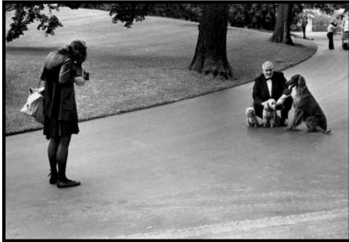
Słynny fotograf Elliott Erwitt zrobił to zdjęcie Diany Arbus w Waszyngtonie krótko przed jej samobójczą śmiercią

Po skończeniu 18 lat Diane wyszła za mąż za swoją wielką miłość, fotografa i początkującego aktora Allana Arbusa. Rodzice, którzy długo sprzeciwiali się związkowi Diane z Allanem, ofiarowali córce w prezencie ślubnym otwarte konto na pięć lat i opłaconą na rok pokojówkę. Diane pracowała z mężem przy sesjach zdjęciowych do ma-